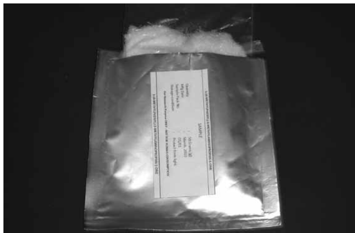
Bild einer abgefangenen Postsendung von 2011 mit einer Forschungschemikalie als Inhalt.

Seitens der Polizei muss mit den bestehenden, begrenzten Ressourcen eine bestmögliche Wirkung erzielt werden. Die Wahrung von Sicherheit und Ordnung hat für die Öffentlichkeit und somit die Politik oberste Priorität. Der kriminalpolizeilichen Bekämpfung des Drogenhandels und der organisierten Kriminalität kommt ebenfalls eine grosse Bedeutung zu. Hier sind den ErmittlerInnen sehr enge Ressourcengrenzen gesetzt. Die Verfahren und die Beweisführung wurden in den vergangenen Jahren aus technischen und administrativen Gründen zunehmend aufwändig und kompliziert. Aber auch Repressivmassnahmen gegen den Konsum wird es weiterhin geben. Idealerweise zielen diese aber auf den Konsum an Orten und in Situationen, wo sie gesellschaftliche besonders unerwünscht sind: Im Umfeld von Schulen, bei Teilnehmern im Strassenverkehr, im öffentlichen Raum.